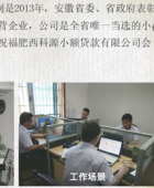
员工合影二 工作场景

小额贷款公司, 四年来的小贷公司正一步一个脚印按照规划向前发展, 而公司的团队也在经历磨炼后, 迅速成长起来。