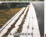
未及时清除的杂草