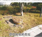
未及时清除的杂草