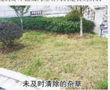
未及时清除的杂草