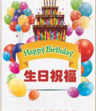
生日祝福 中心已竣工 中心已竣工 中心已竣工

随着集团业务的不断发展，集团需要不断涌现新的人才在这里实现自己人生梦想的同时，实现企业价值的最大化。